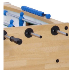
Dettaglio aste uscenti

Se il calciabalilla è provvisto di aste uscenti , spiegare ai bambini di non avvicinare il viso alle parti delle aste che fuoriescono e sorvegliare il gioco.