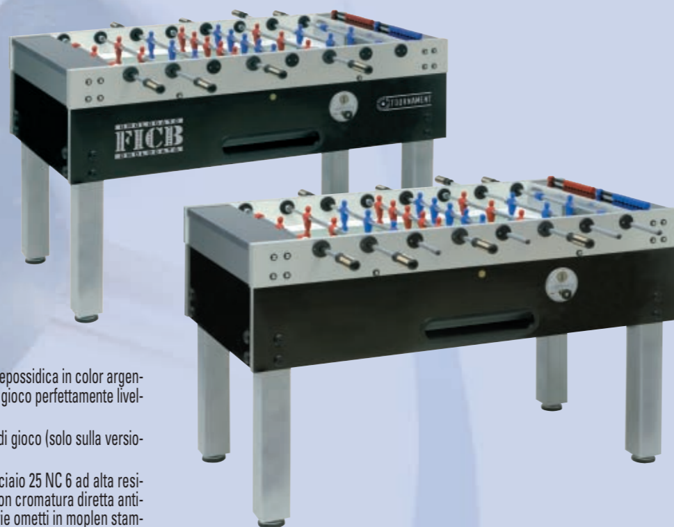
TABELLA TECNICA • TECHNICAL CHART • TECHNISCHE TABELLE

15 In dotazione 10 palline gialle (calciobalilla omologata FICB) oppure 10 palline bianche Standard (calciobalilla non omologata).